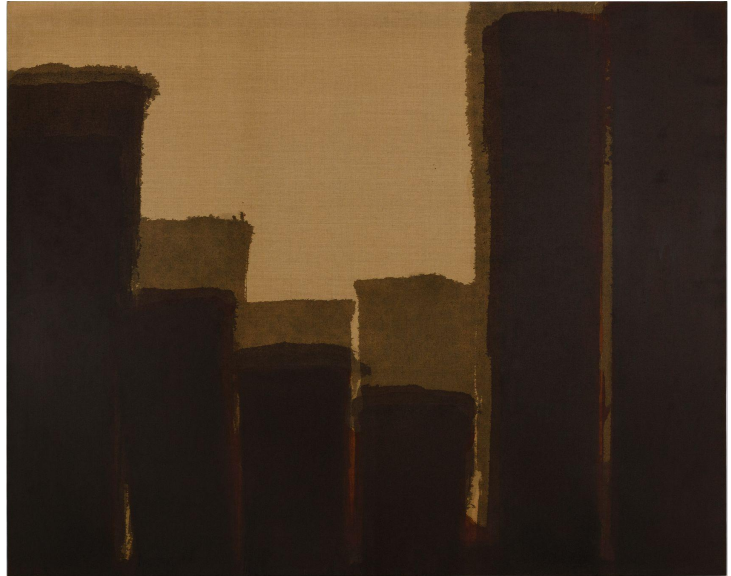
Yun Hyong-keun, Burnt Umber , 1980.

7 January–23 February 2023 108, rue Vieille du Temple 75003 Paris