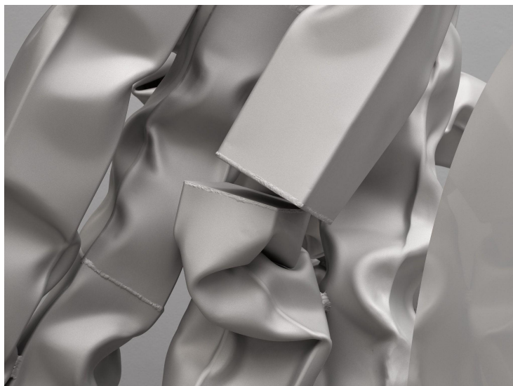
Carol Bove, Vase Face III / The Skeleton Juggling a Baby in the Central Tableau of Heaven , 2022 (detail).