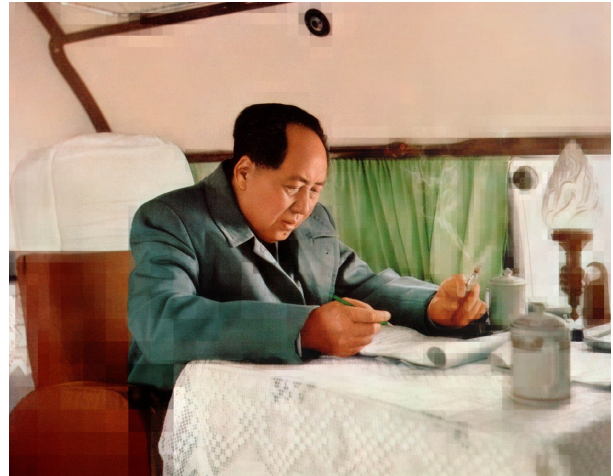
Thomas Ruff, tableau chinois_06 , 2019 © Thomas Ruff/VG Bild Kunst, Bonn/Artists Rights Society (ARS), New York Courtesy the artist and David Zwirner

14 January–6 March 2021 108, rue Vieille du Temple 75003 Paris